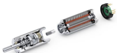
Sistema di azionamento steri- lizzabile con motore BLDC, ridut- tore e encoder integrato.