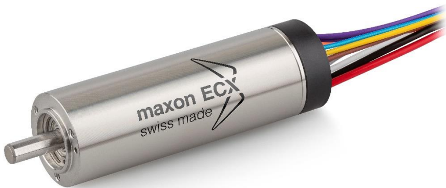
ECX SPEED 19 L: il motore DC brushless con velocità elevate.