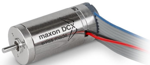
ENX 16 RIO – in combinazione con un motore DC configurabile (DCX 16 S), ©maxon motor ag